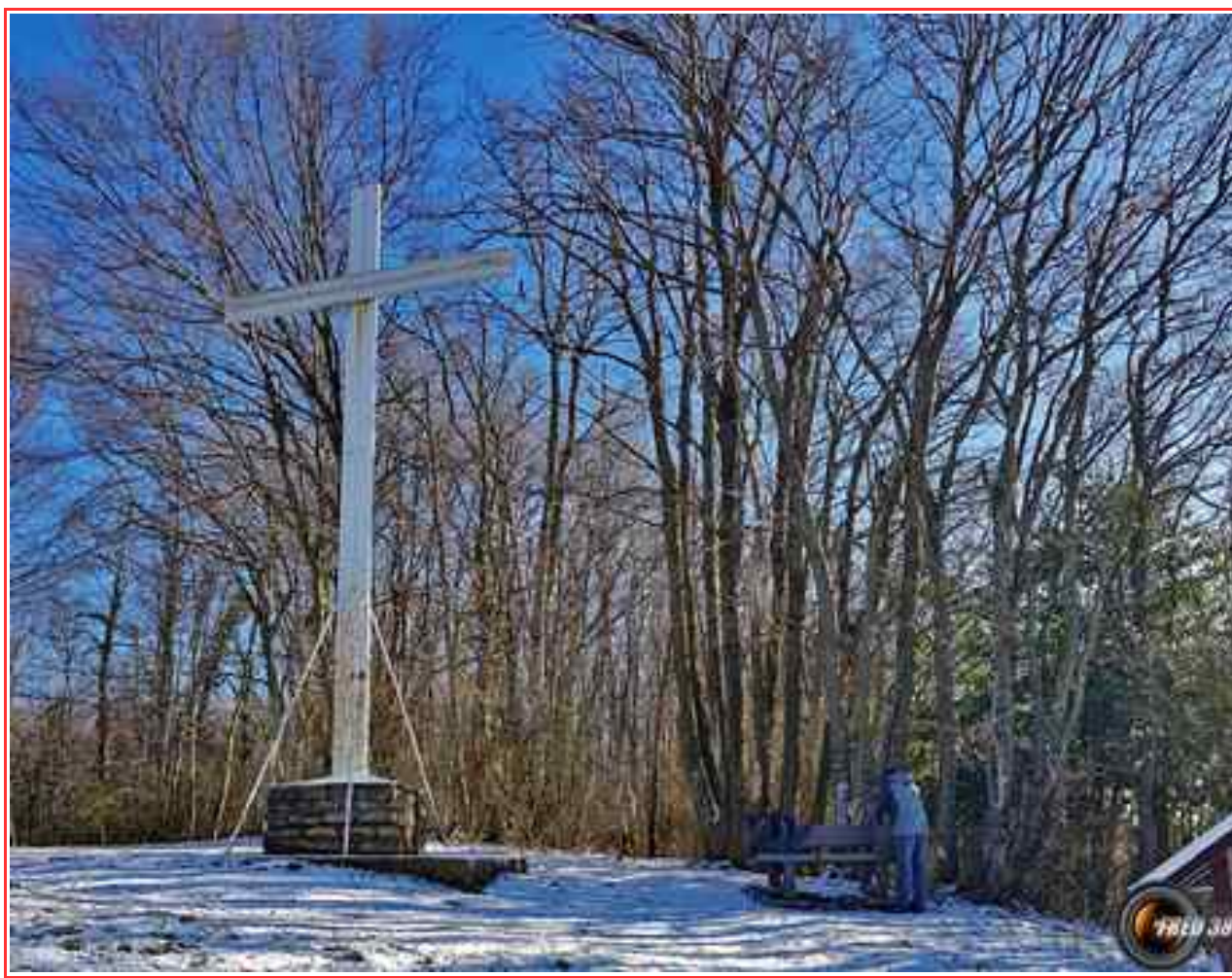
La grande croix du sommet.