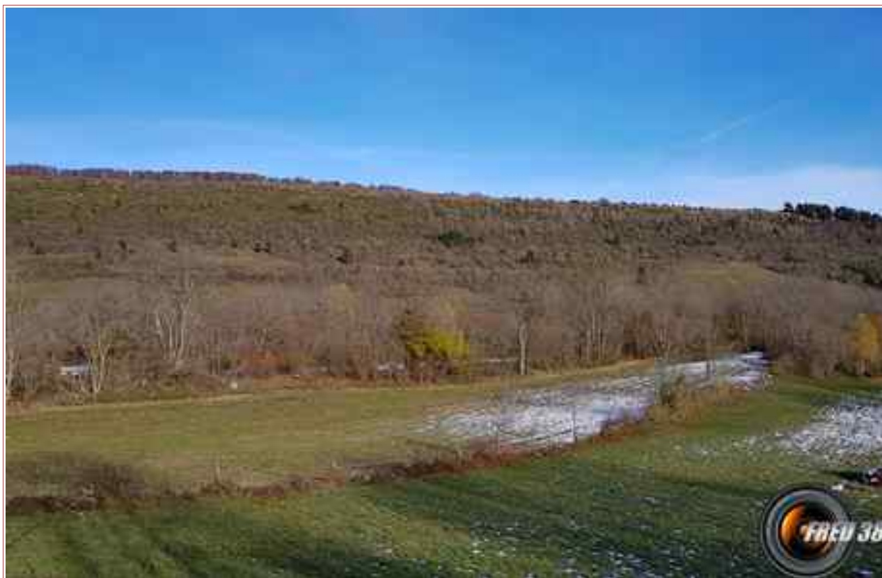
La crête vue d'Innimond.