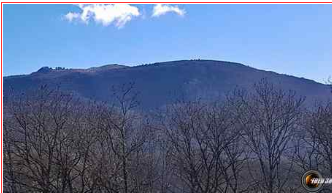
La montagne de Sérémond vue de Virieu le Grand.