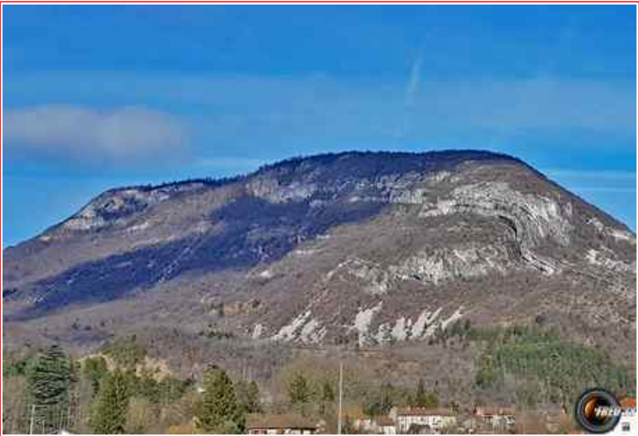
La montagne de Sérémond vue de Virieu le Grand.