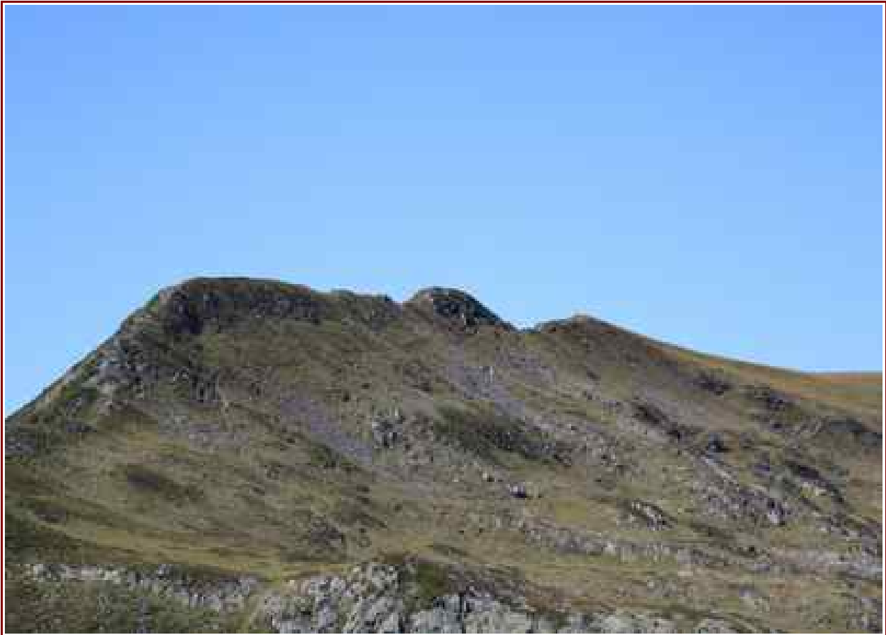
L'Aiguillette des Houches vu du plateau sous le Brévent