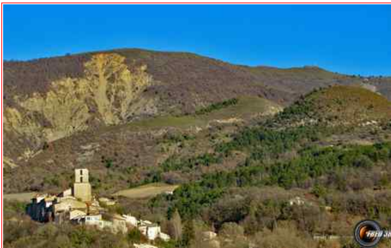
Thoard et en fond le sommet.