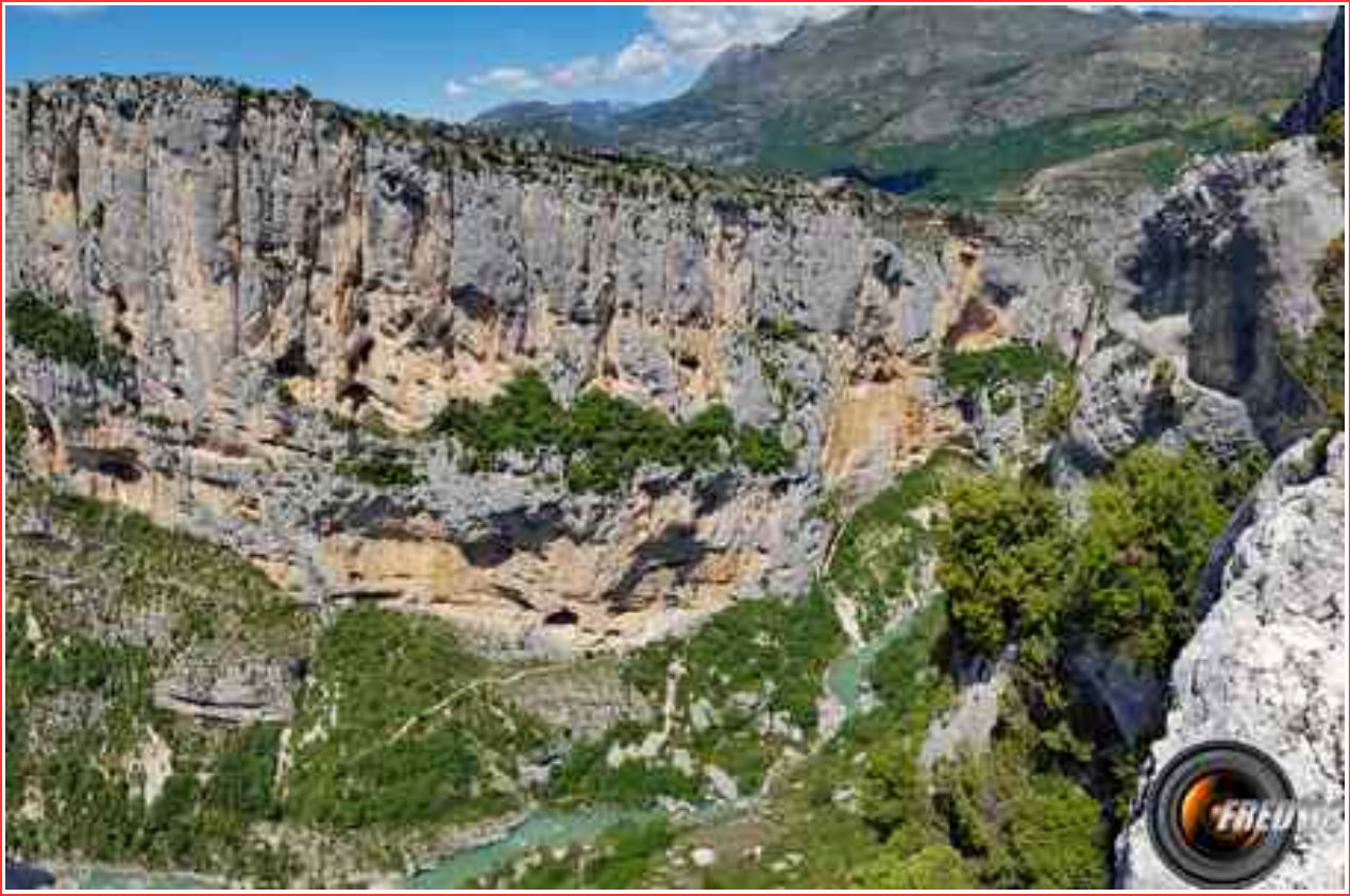
Le Verdon et le sentier Martel.