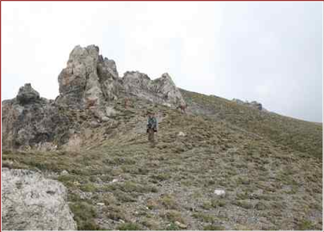
Les rochers ruiniformes au dessus de la Baisse