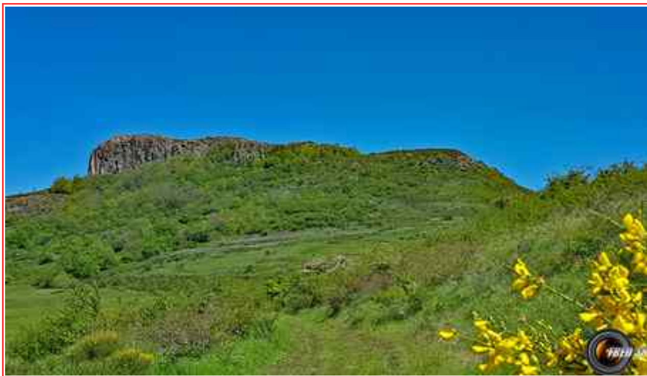
Le sommet vu avant Gourdon.