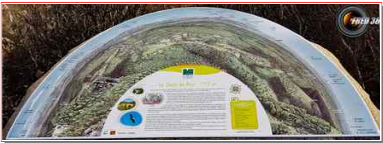
La table d'orientation du sommet.

Itinéraire boucle 13 km, pour 650 m de dénivelé positif.