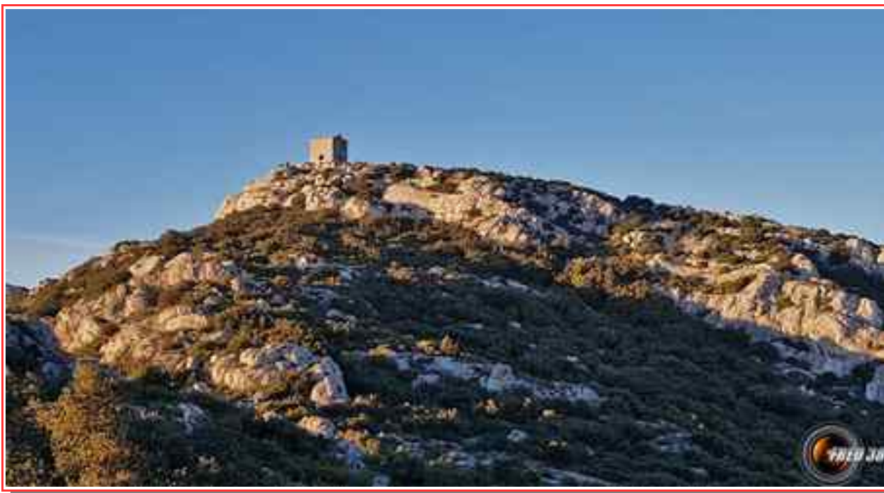
La tour vue en cours de montée.