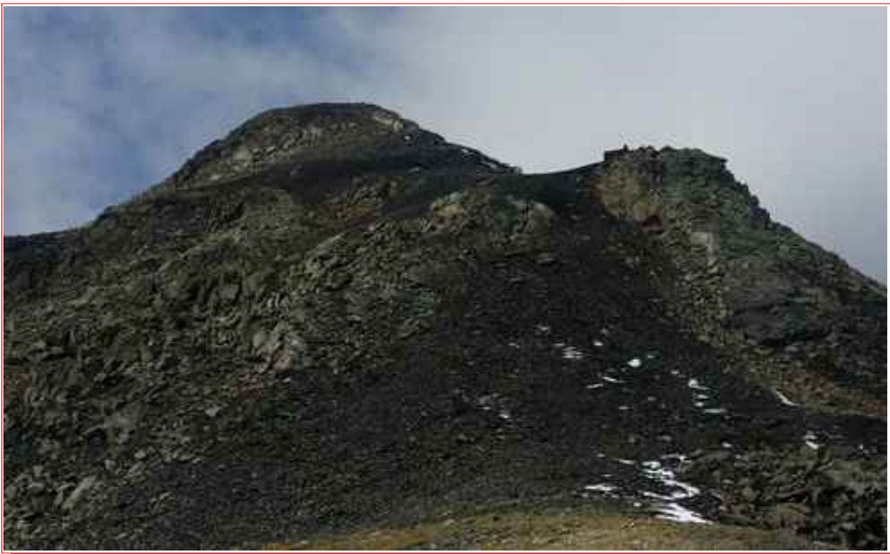
La crête finale vu du col des Rousses.