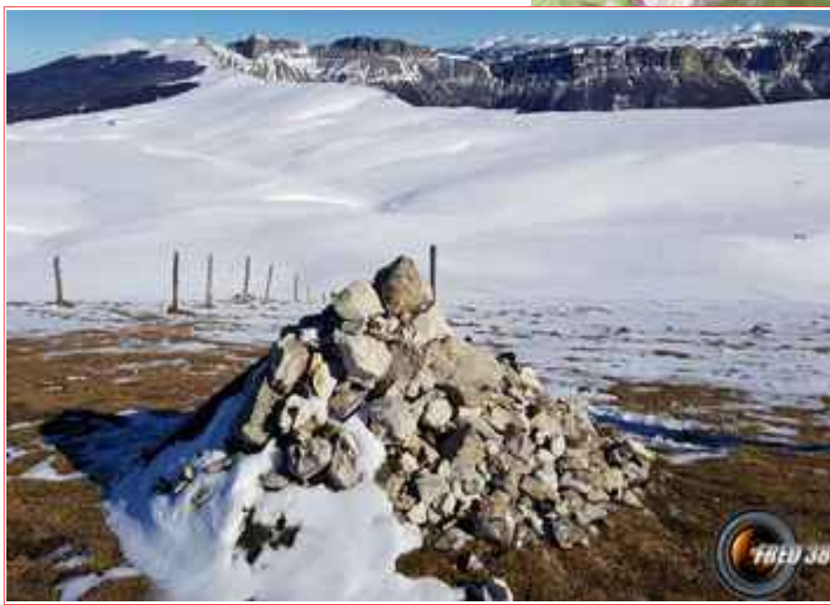
Le sommet et le plateau d'Ambel