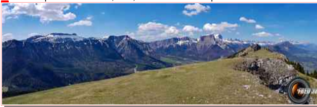
Du sommet, vu sur la chaîne du Vercors

Itinéraire pour le sommet 6,5 km, 670 m de dénivelé positif.