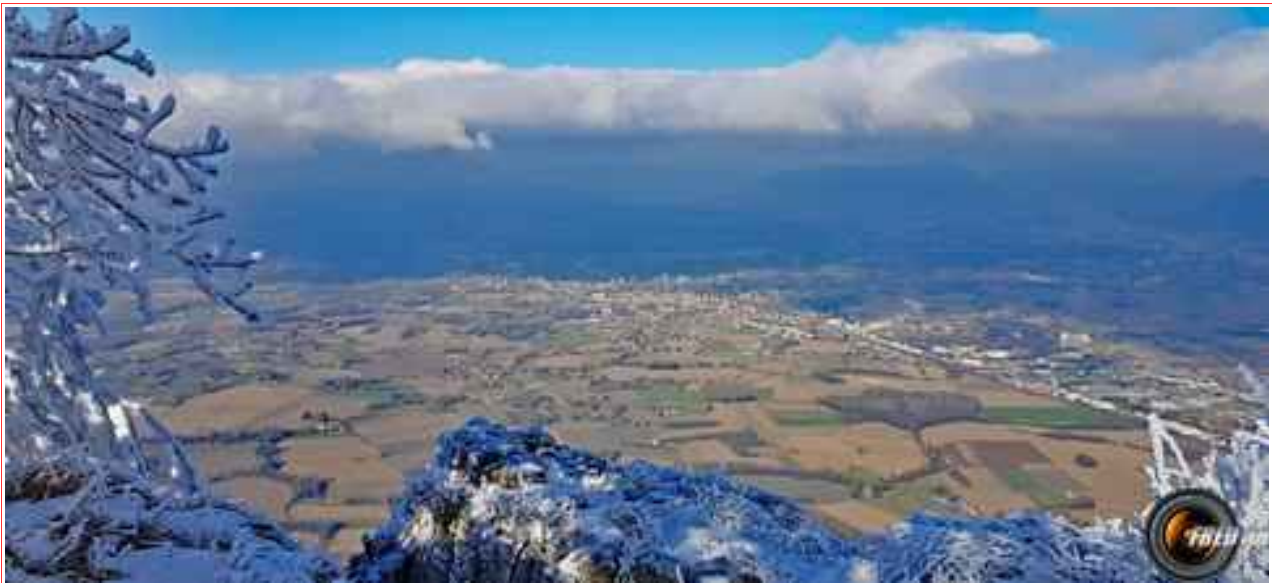
La plaine de l'Isère vue du sommet.

Itinéraire distance 7 km, dénivelé 300 m.