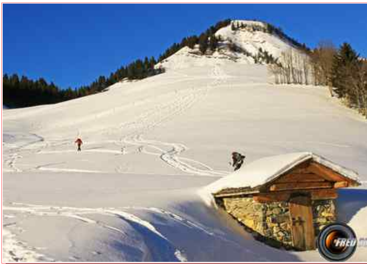
Le sommet vu du chalet des Zorons