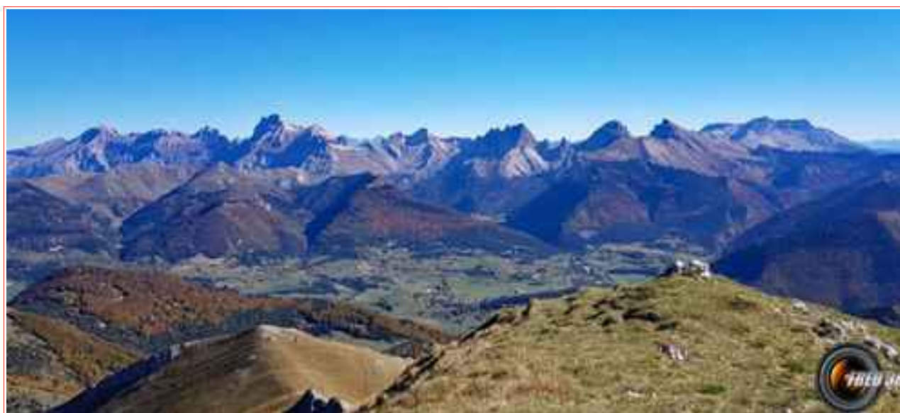
Le Dévoluy vu du sommet.

Itinéraire boucle 9 km, 980 m de dénivelé.