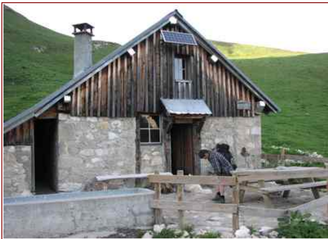
Refuge du Charbon ® 1660 m.

Itinéraire 16 km, pour 1650 m de dénivelé positif.