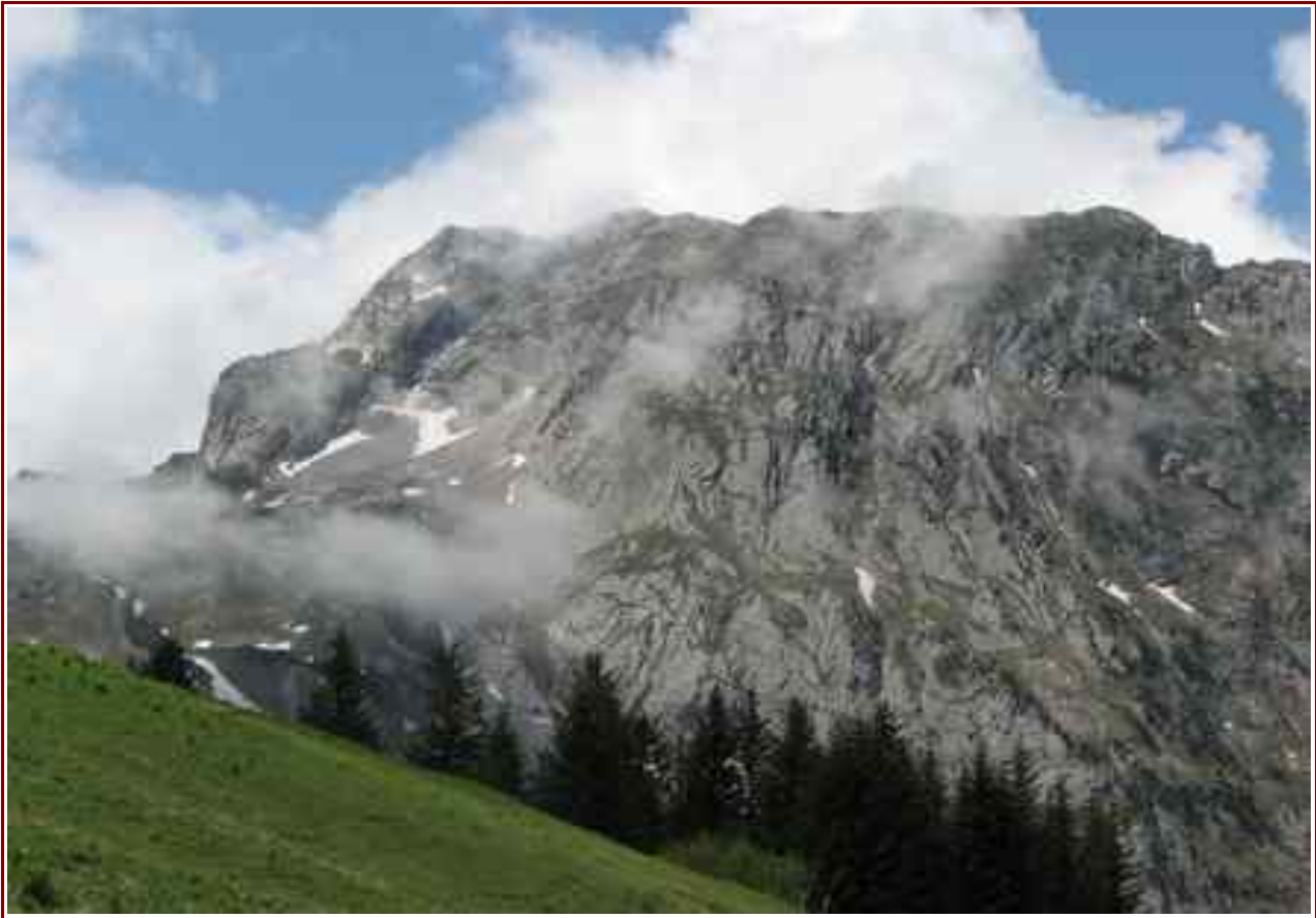
l'Arcalod vu en dessous du col d'Orgeval