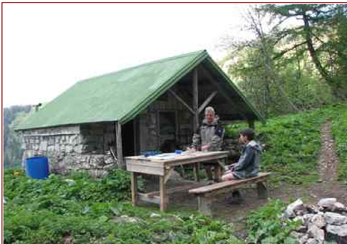
Cabane de Bonverdan ® 1520 m.

Itinéraire 9 km, pour 1360 m de dénivelé positif.