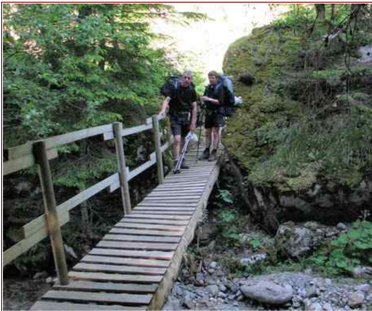
Traversée du torrent de la combe d'Ire.

Itinéraire assez difficile, compte tenu des dénivelés et des distances qui composent chacune de ces trois étapes. Pas de ravitaillement en cours de route.