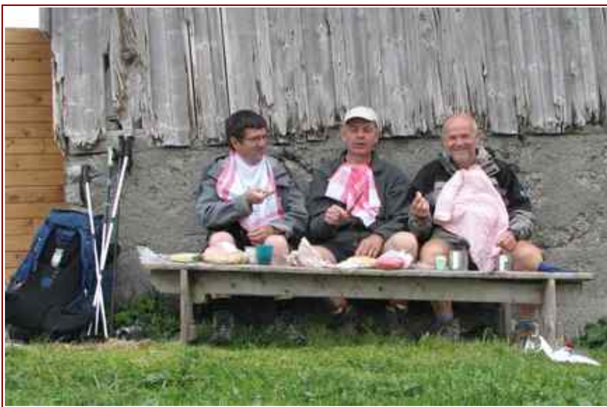
Pique nique près de la grange de l'Aulp de Seythenex ® 1719m.