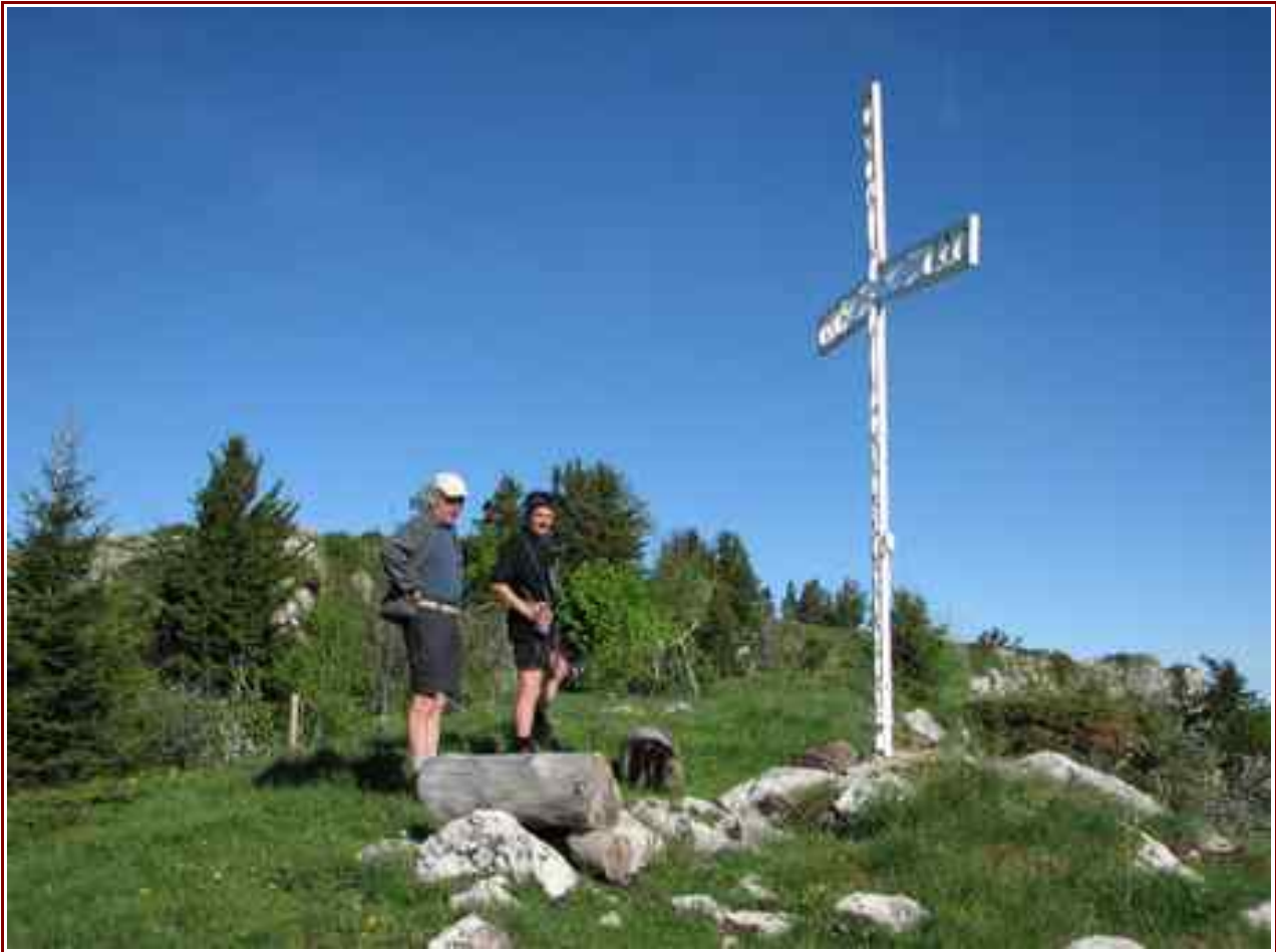
La Table du Roy 1711 m.