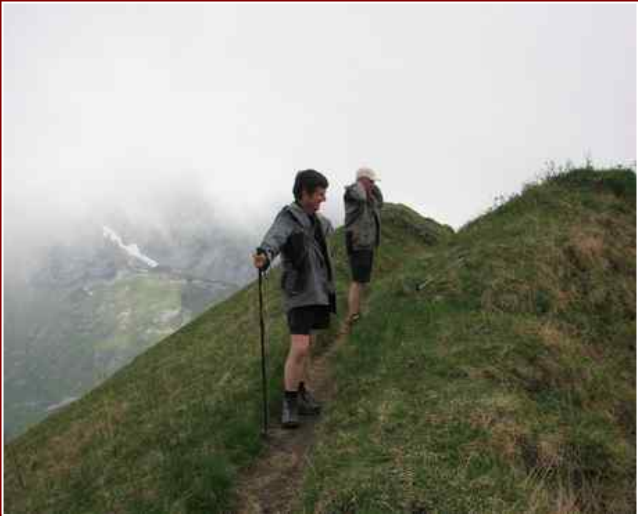
La montée à la pointe de Chaurionde.