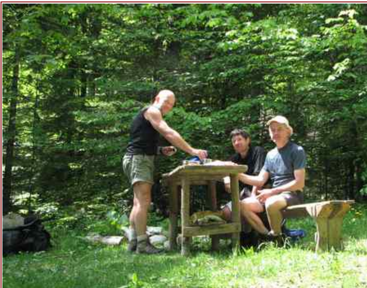
La Fontaine du Fayard 1148 m.

Itinéraire 15,3 km, pour 1412 m de dénivelé positif.