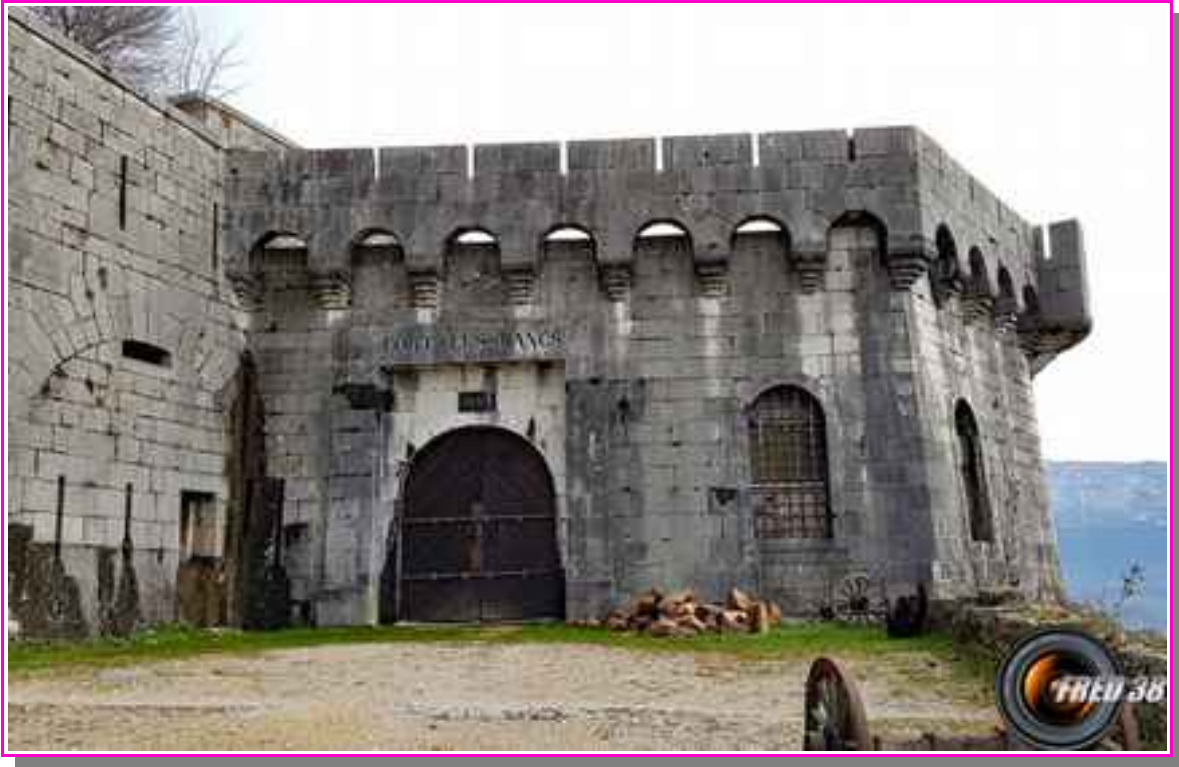
Le fort « Les Bancs »