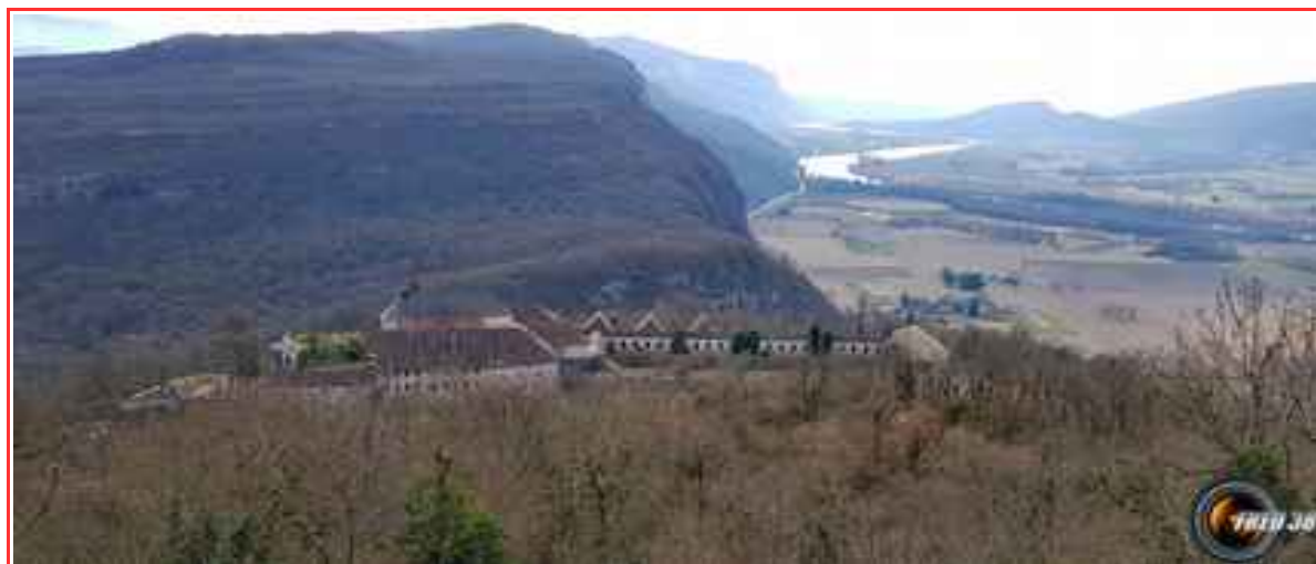
L'ancien couvent fortifié de Pierre Chatel.