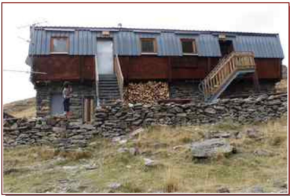
Refuge CAF du Mont Pourri ® 2370 m.

— Troisième étape 14 km, 1085 m de dénivelé positif, 1098 m de dénivelé négatif.