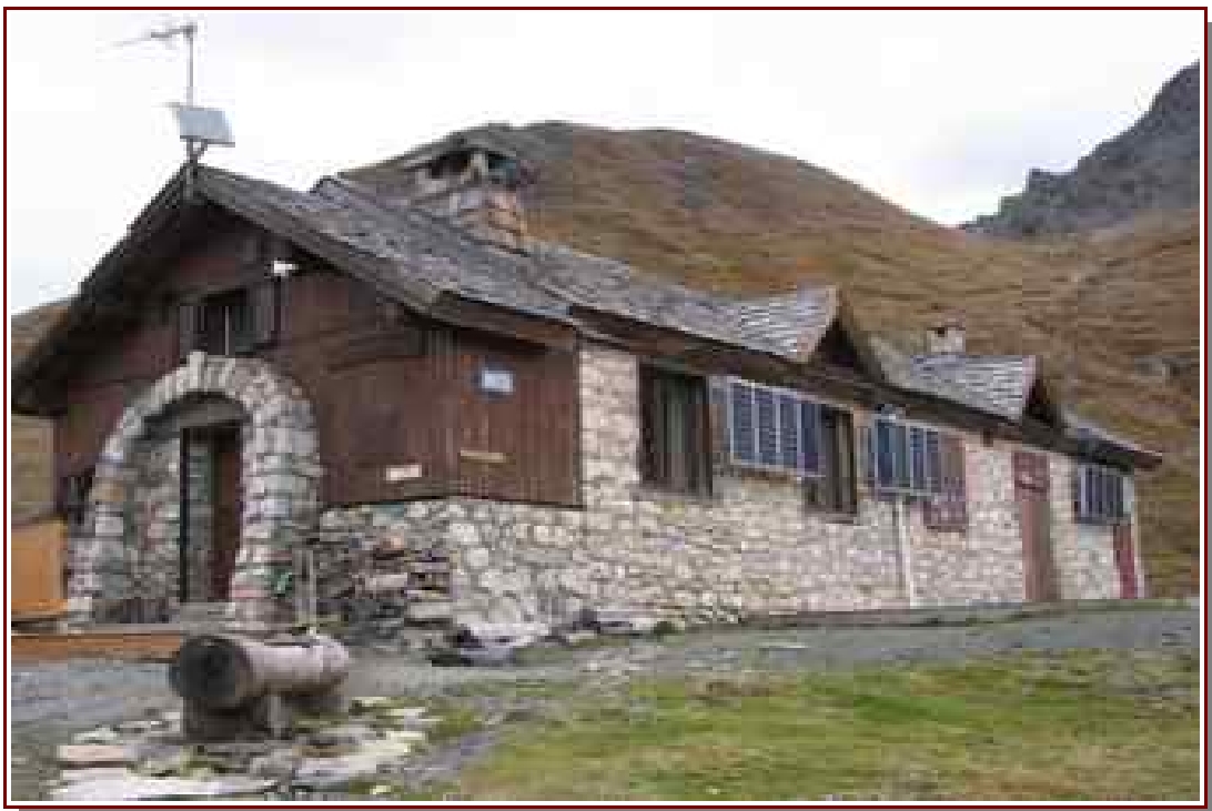
Refuge PNV du col du Palet ® 2587 m.

Quatrième étape 14 km, 1079 m de dénivelé positif, 858 m de dénivelé négatif.