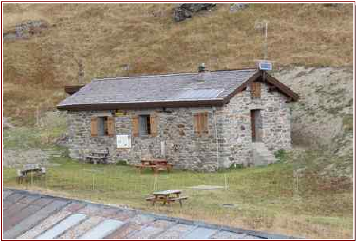
Refuge PNV de La Martin ® 2154 m.

Première étape 6 km, 535 m de dénivelé positif, 169 m de dénivelé négatif.