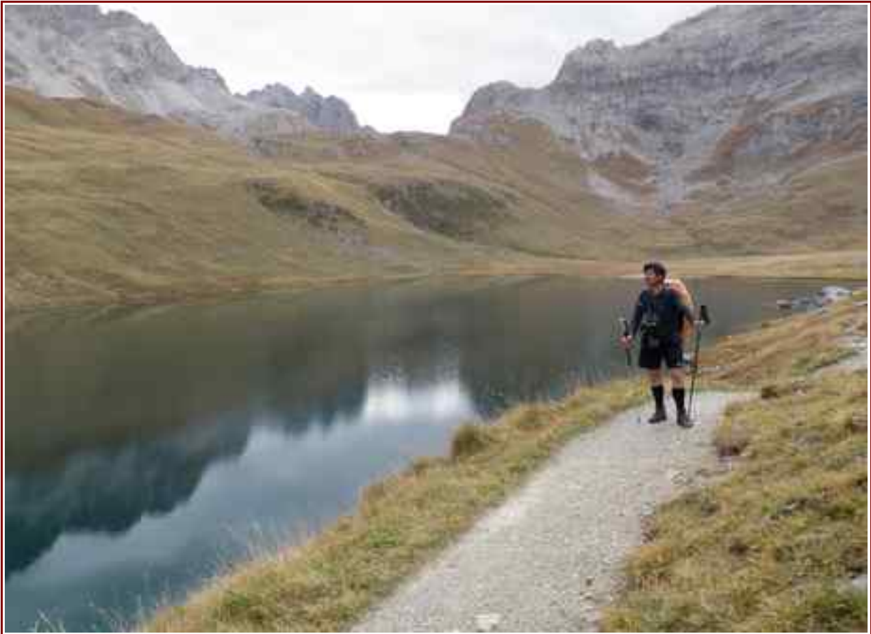
Lac de la Plagne