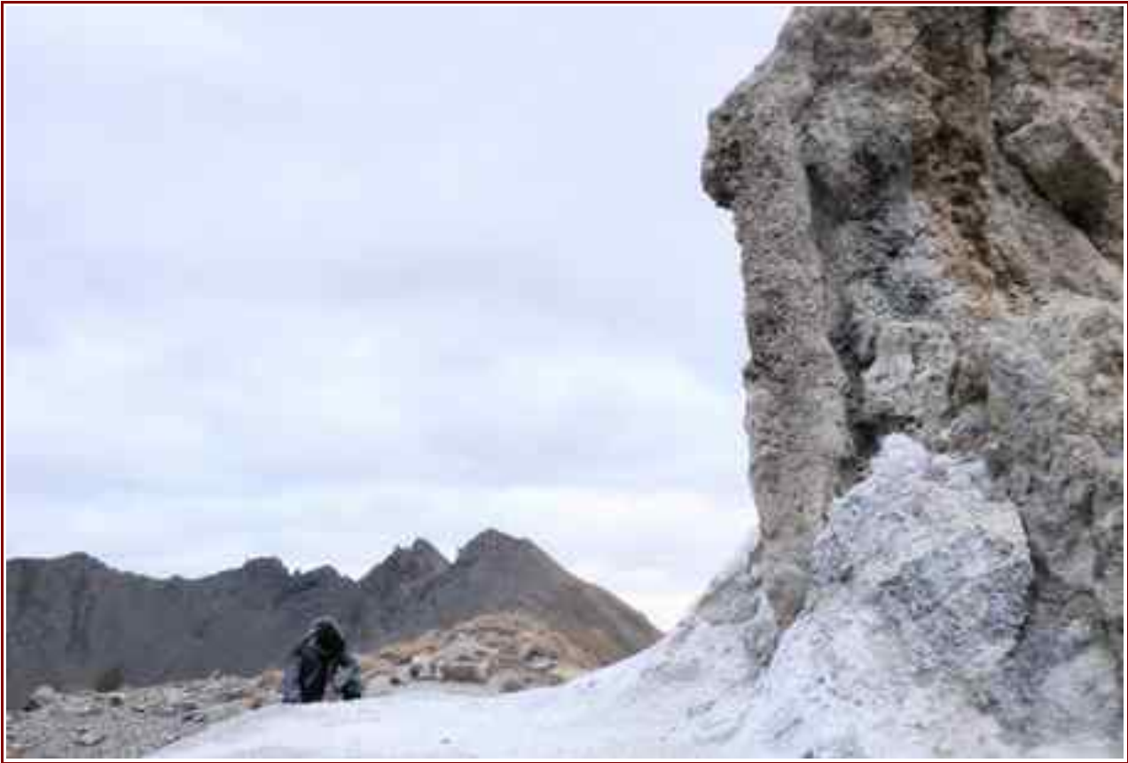
Col de la Croix des Frettes, en fond la pointe du Chardonnet