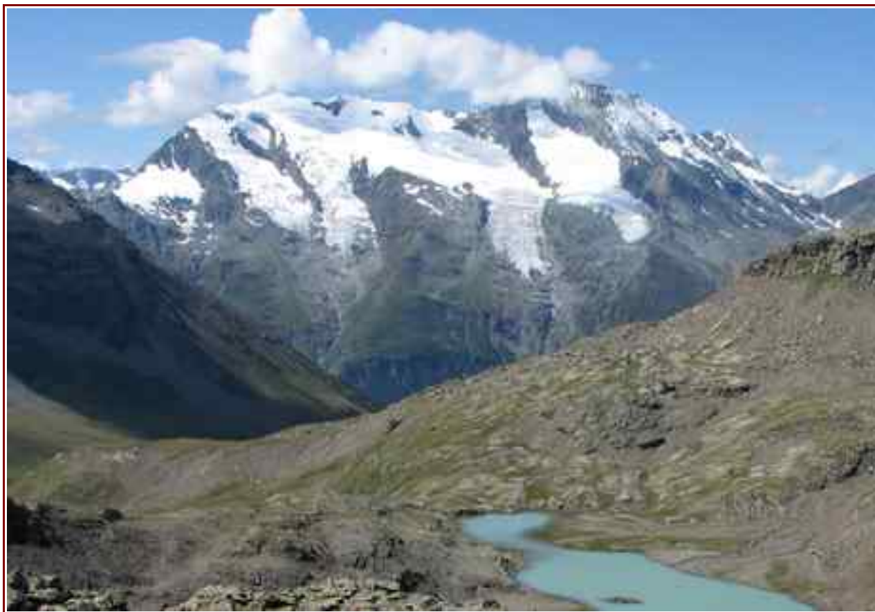
Le mont Pourri vu du vallon au dessus du Monal