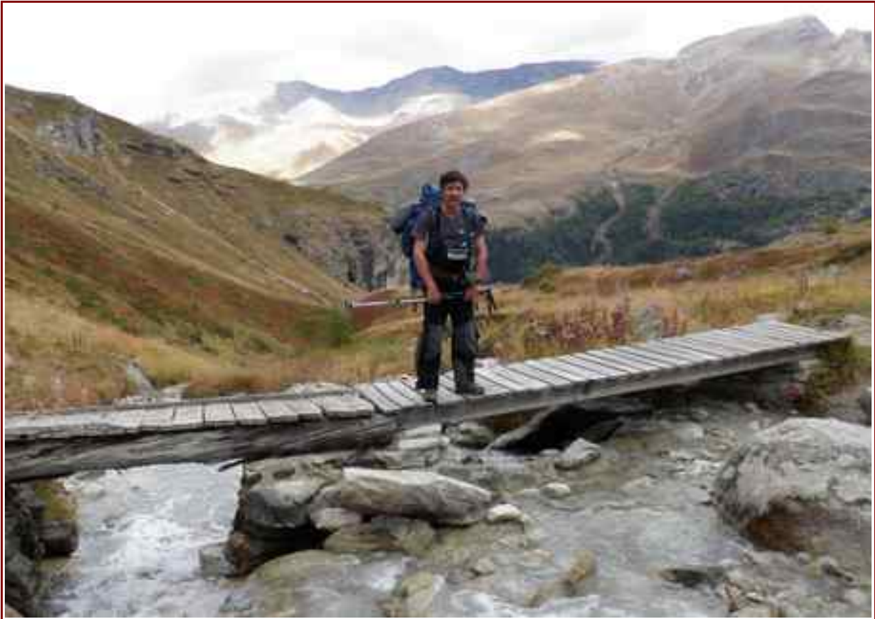
Passerelle sur le ruisseau de la Sachette