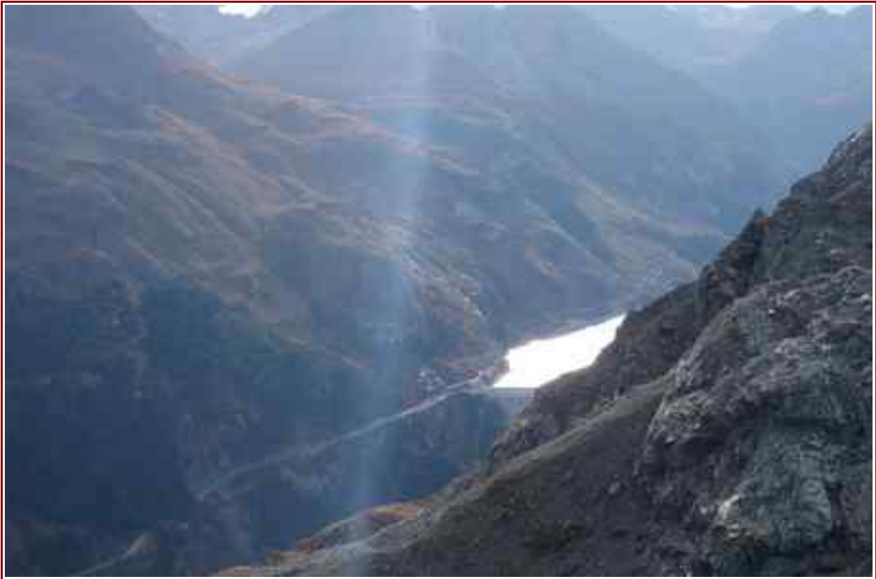
Lac de Chavril vu du bas du glacier de la Savinaz