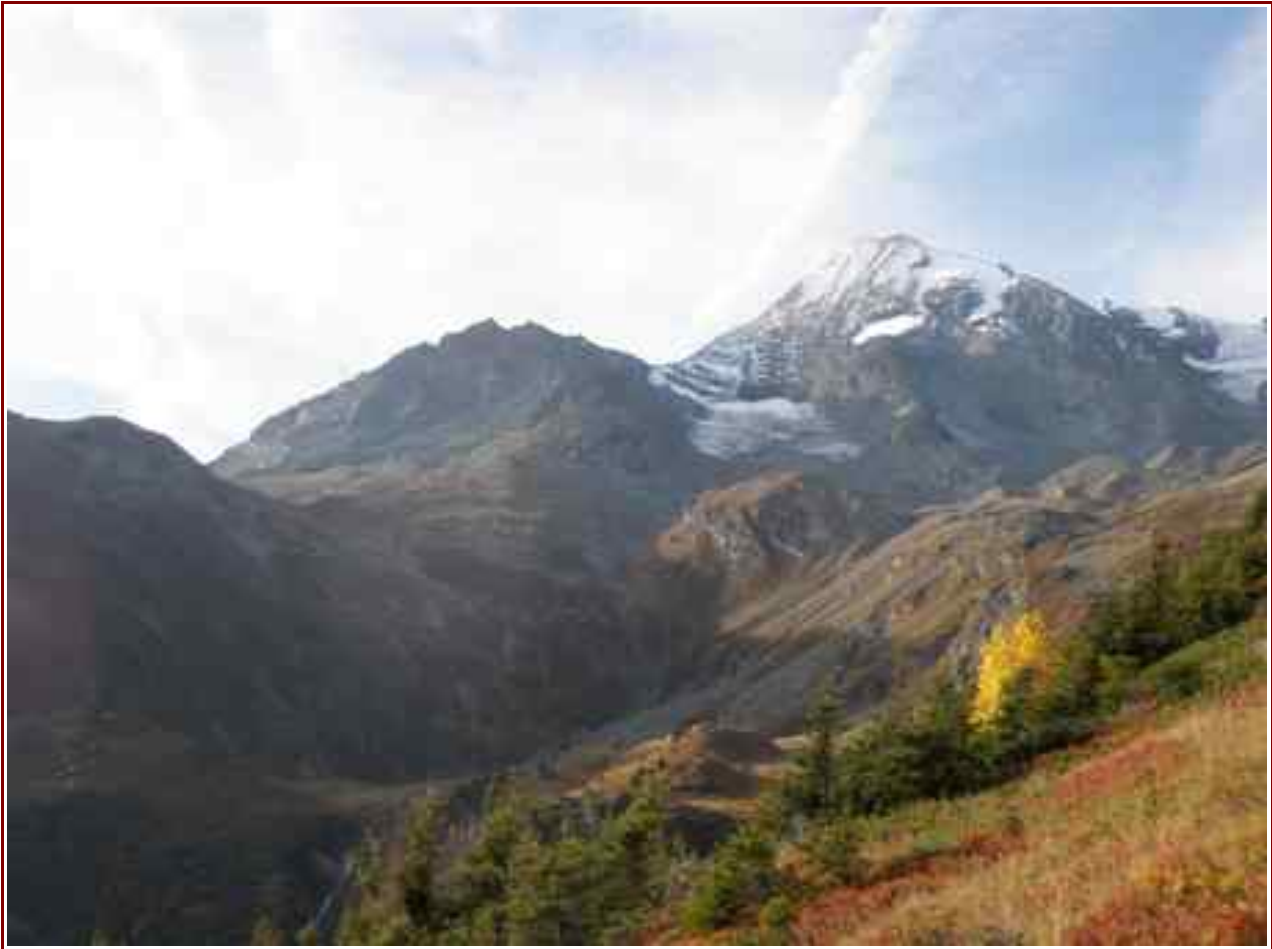
Le Mont Pourri vu du col de Riondaz