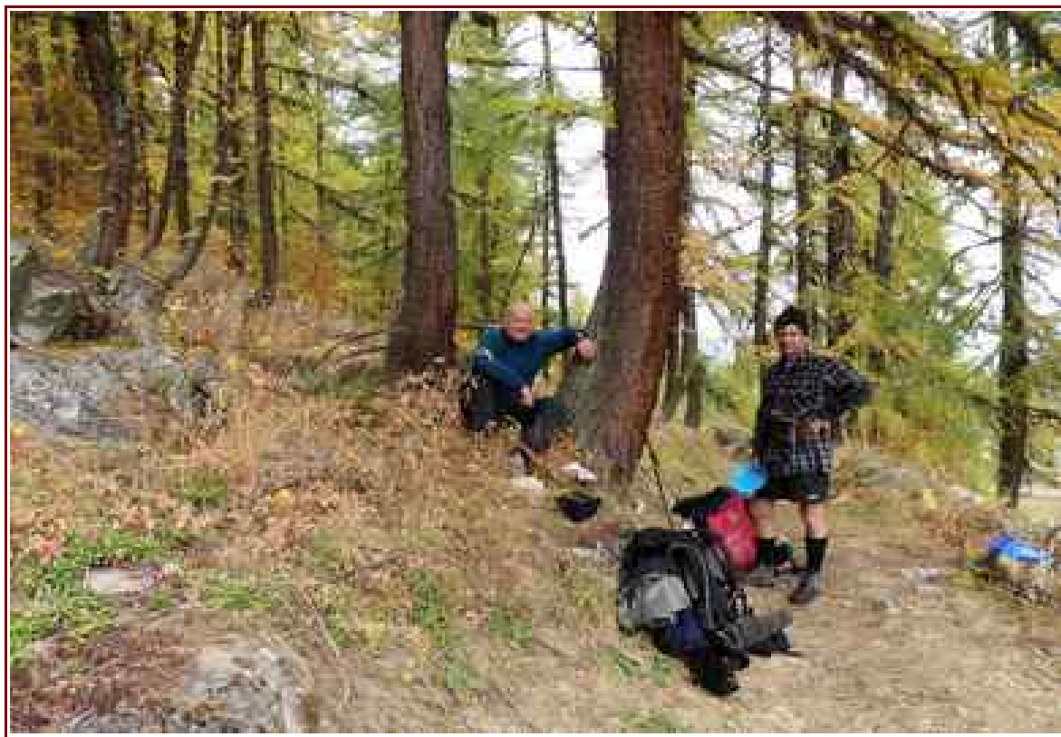
Juste avant d'arriver au hameau des Boisses