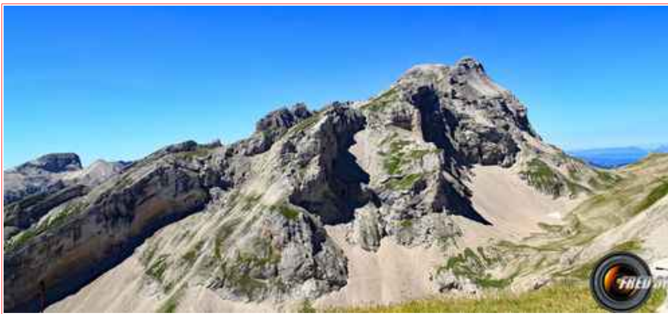
Le Grand Ferrand vu du sommet.

Itinéraire : Dénivelé 1100 m Longueur 4,5 km