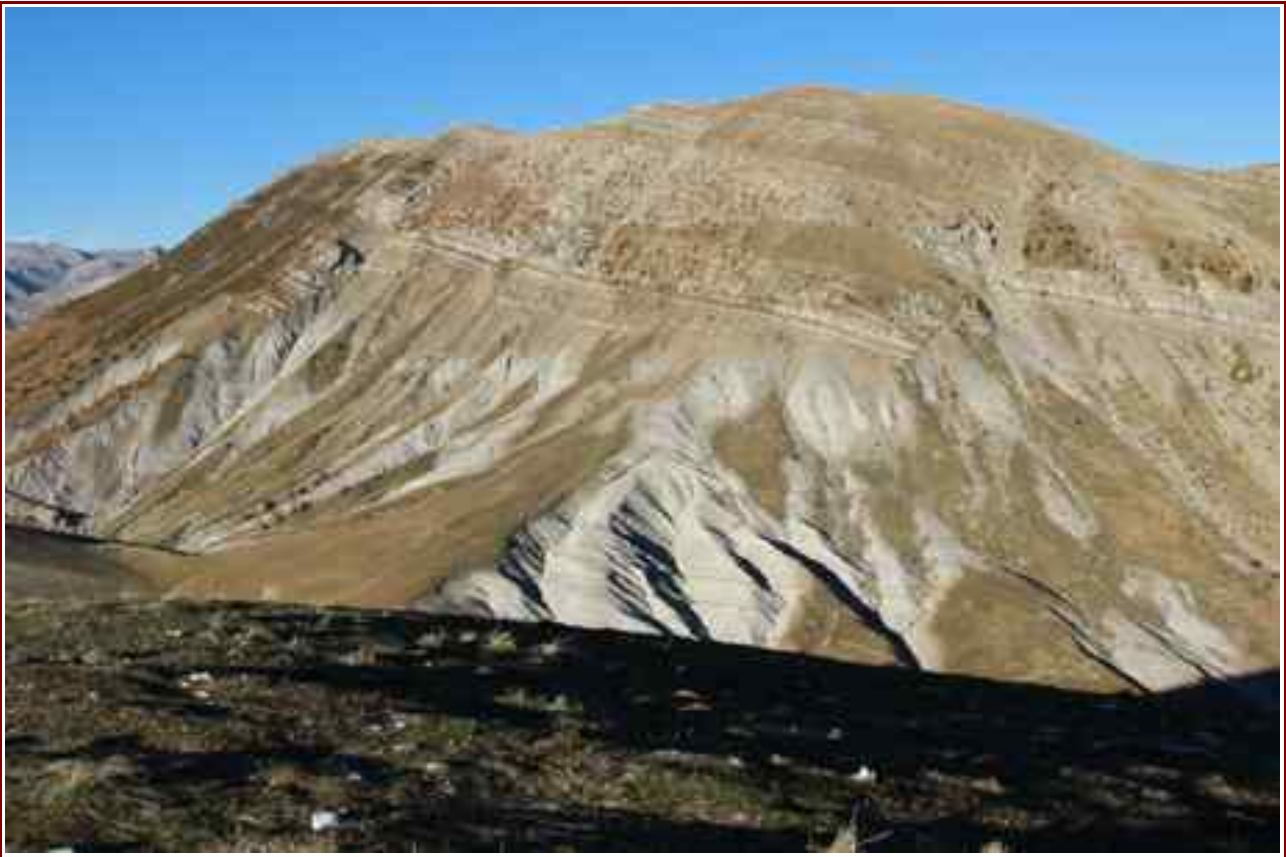
Le sommet de Denjuan vu du sommet de Peymian.

MASSIF : Pré-Alpes de Haute Provence CARTE : IGN 3440 ET