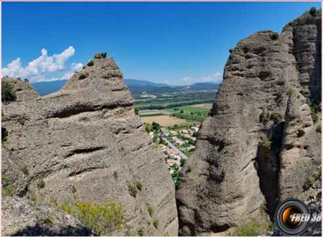
Le haut des Pénitents.

MASSIF : Pré-Alpes de Haute Provence CARTE : IGN 3440 ET