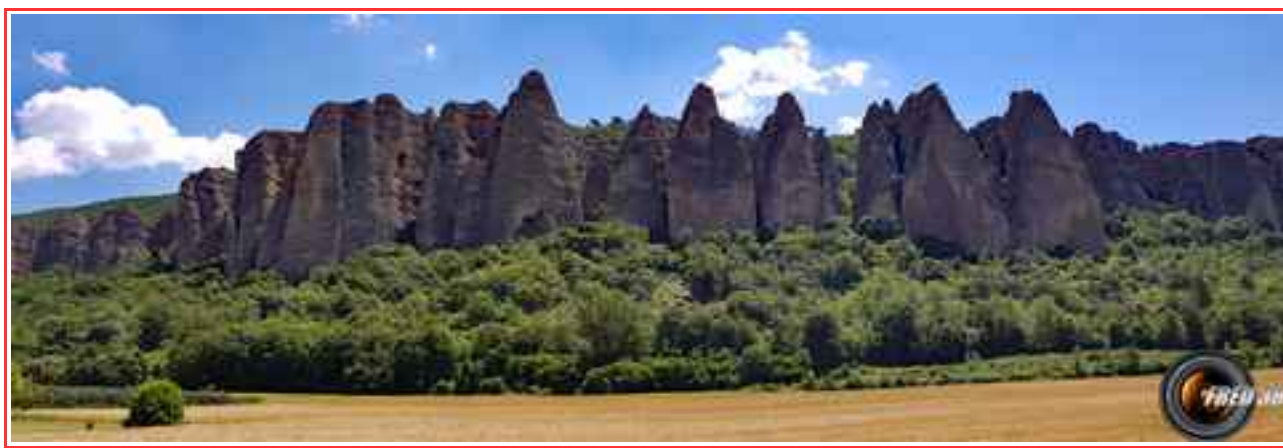
Le massif des Pénitents.