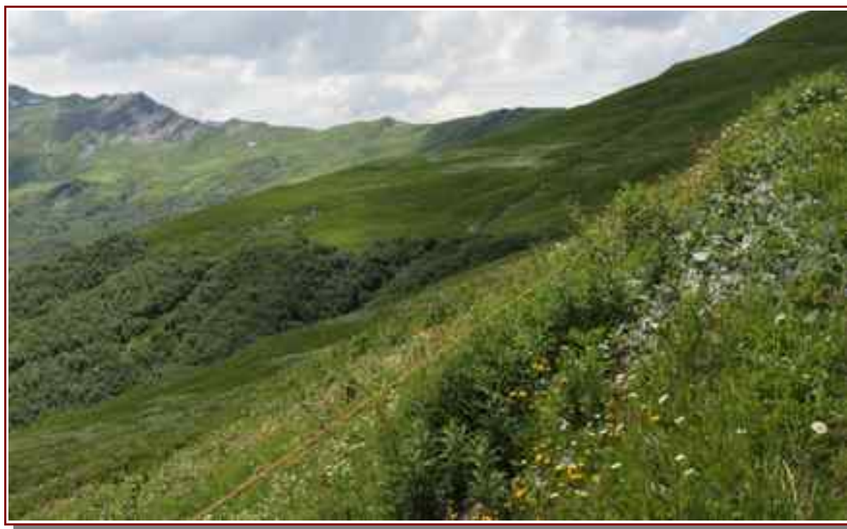
La ligne de crête

Itinéraire de montée 11,7 km, 1041m de dénivelé positif.