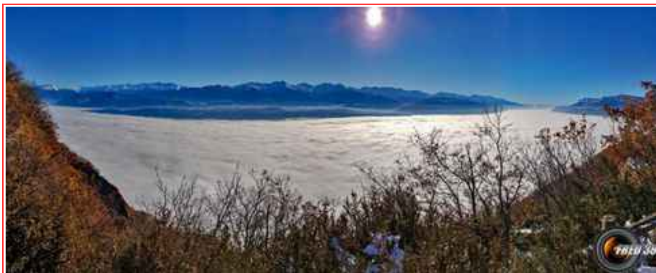
La vallée du Grésivaudan sous les nuages.

— Itinéraire 12 km (A/R), pour 350 m de dénivelé positif.