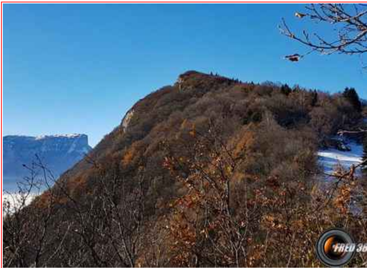
Le sommet vu du rocher de Manettaz