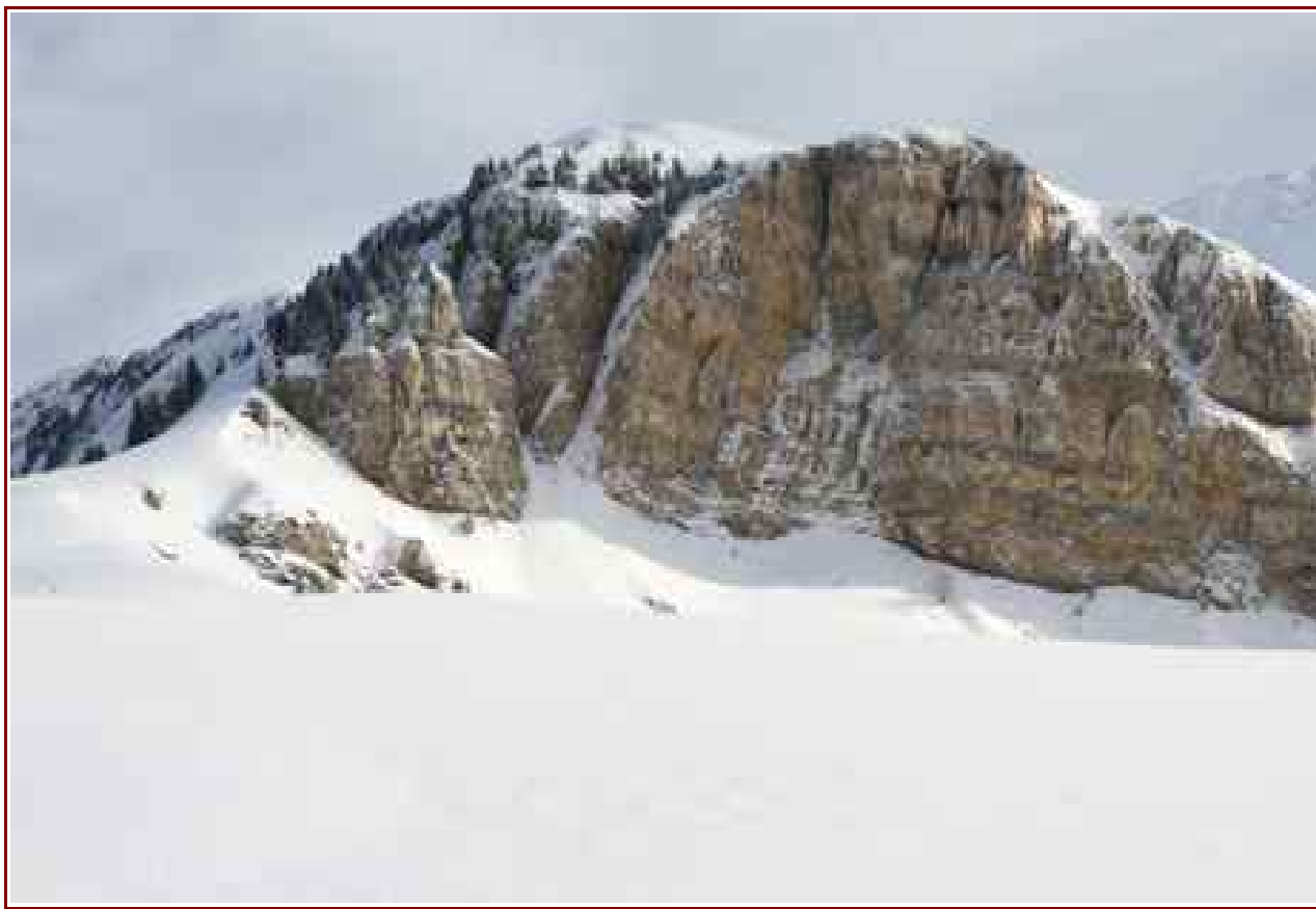
Le Roc Marchand avec la croix sur la droite