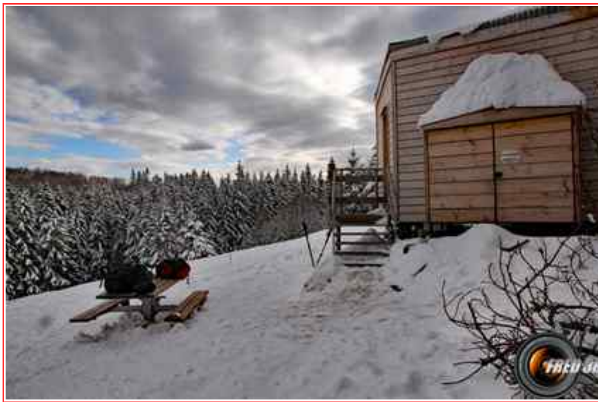
Le refuge de Vassieux.