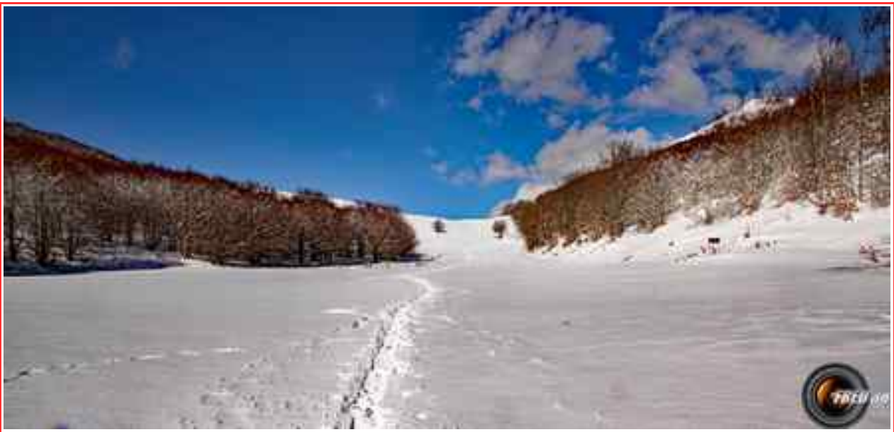
Col de Chirone.

Itinéraire distance 13 km, dénivelé 550 m.