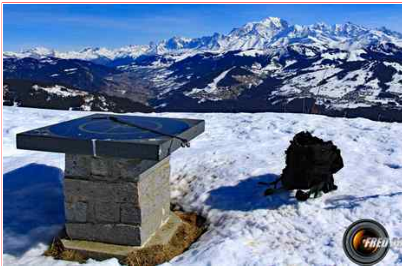
Le sommet, et en fond le Mont-Blanc.