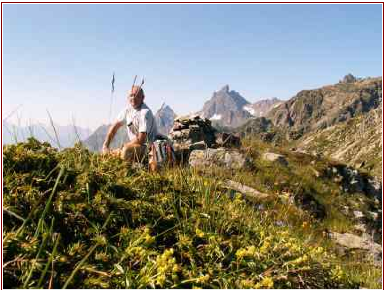
Le sommet avec en fond le Grand Pic de Belledonne

Itinéraire de montée 4,4 km, 933 m de dénivelé positif.