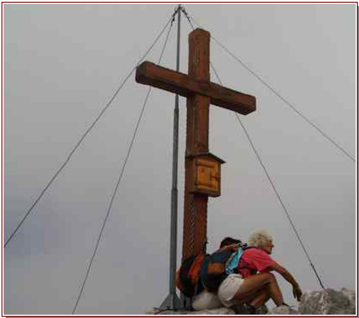
La croix au sommet