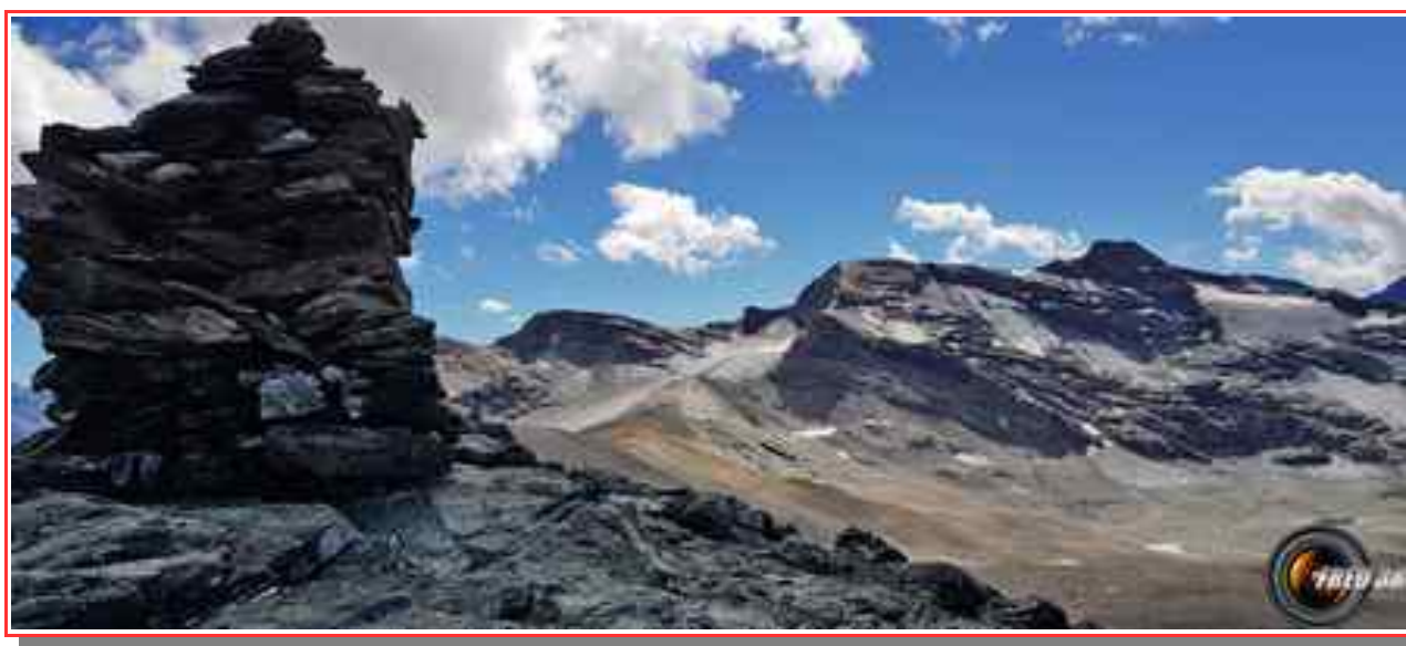
Le sommet et en fond la pointe de Méan Martin.

Itinéraire pour le sommet 6 km, 550 m de dénivelé positif.