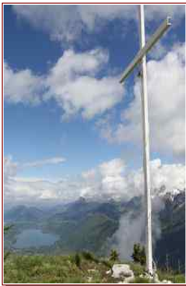
La croix du sommet et le lac d'Annecy en fond