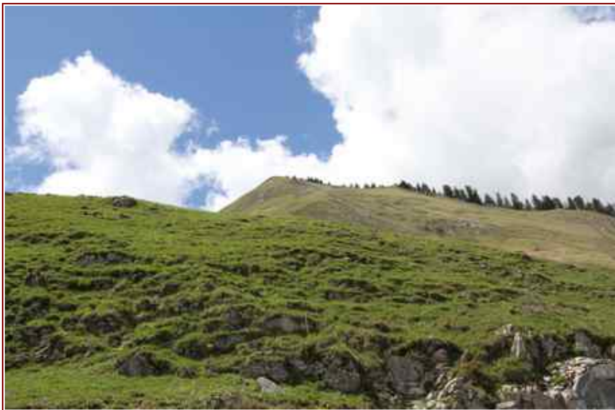
Le sommet vu du chalet de la Servaz