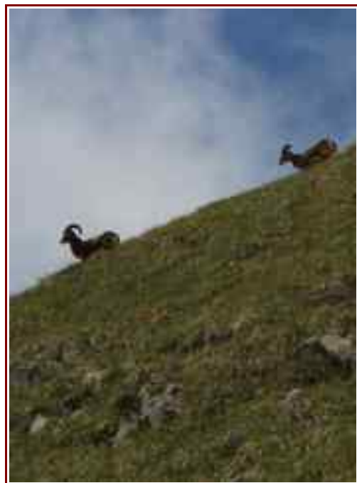
Ci dessous mouflons sous le sommet