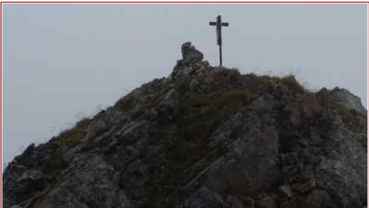
La croix du sommet