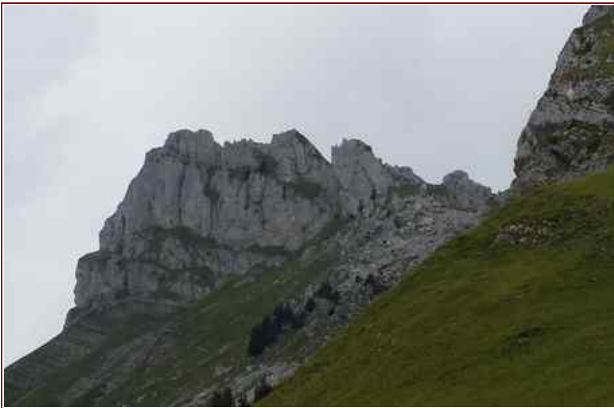
Le sommet vu du chalet de Bouchasse