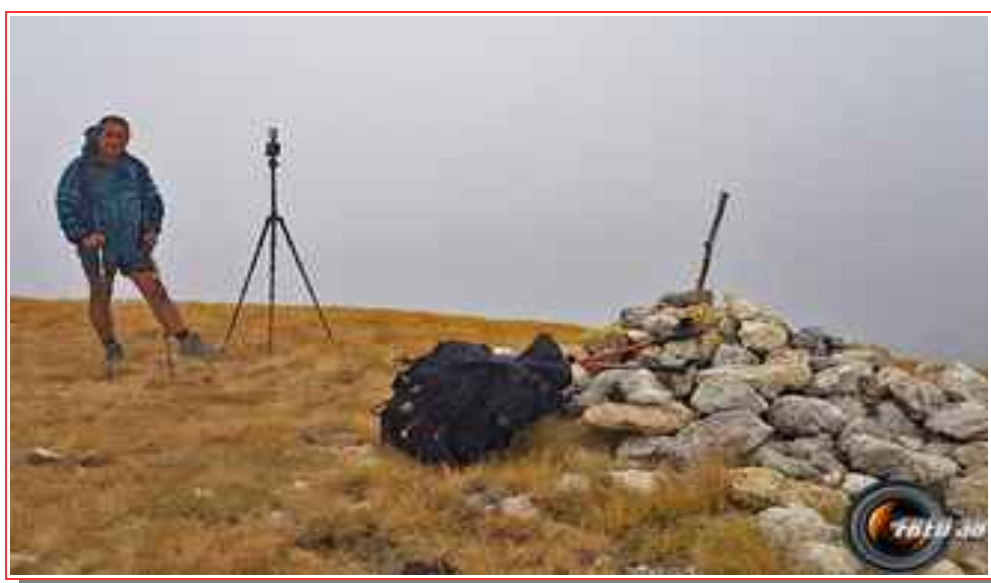
Le sommet dans la brume.

Itinéraire pour le sommet 7 km, 1000 m de dénivelé positif.