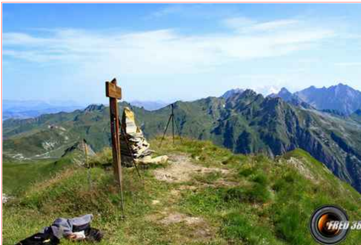
Le mont Blanc vu du sommet.