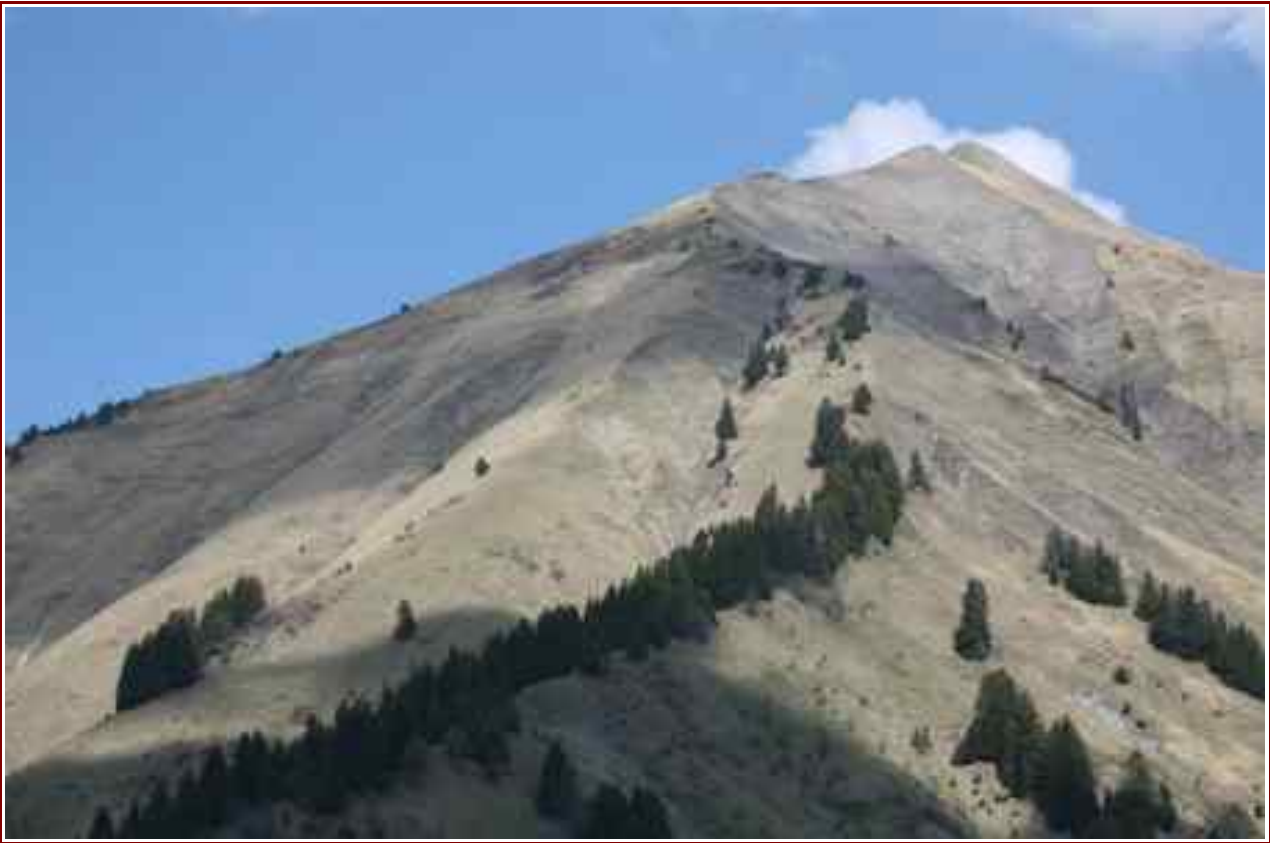
Chaurionde vue du Parc à Moutons