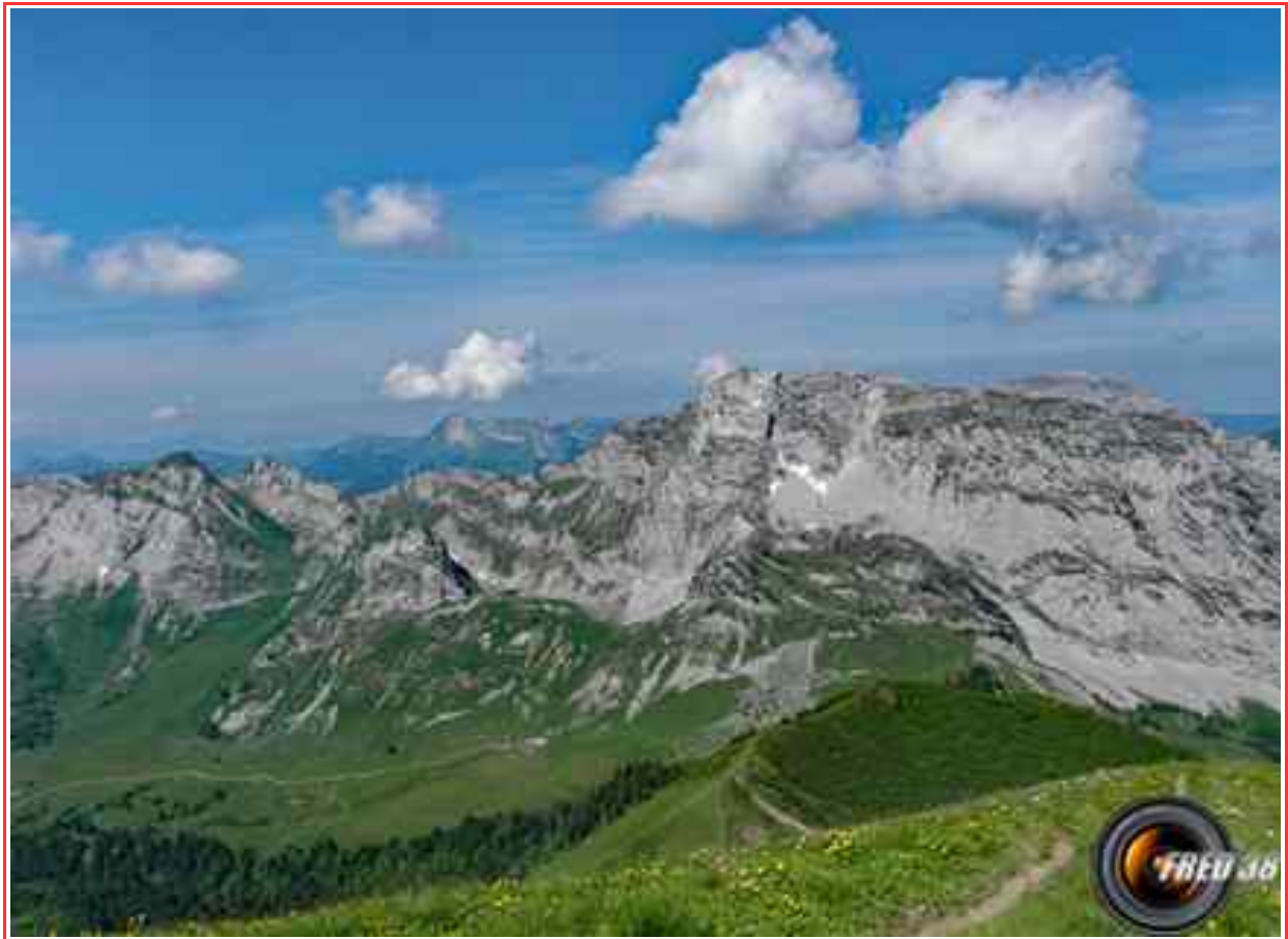
l'Arcalod vu de Chaurionde