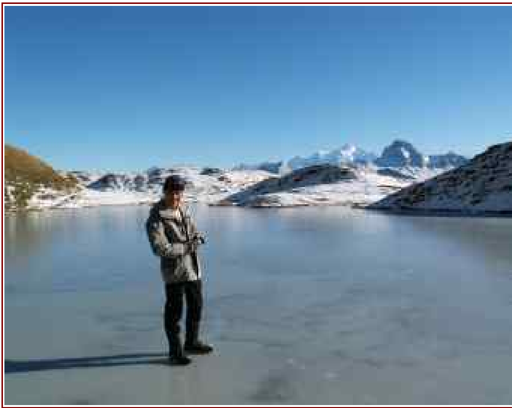
Lac de Peyre sous la glace

— Itinéraire de montée 3,3 km, 750 m de dénivelé positif, 116 m négatif.