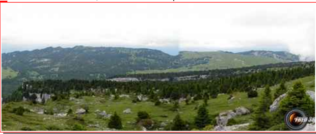
Le plateau vu du Pinet.

Itinéraire boucle 15 km, 900 m de dénivelé positif.