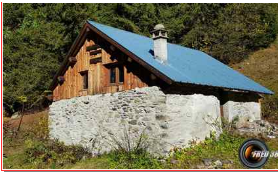
La cabane du Planet,