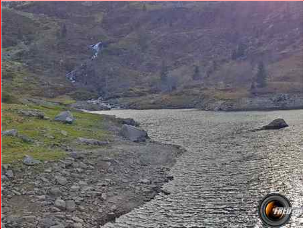
Le lac de Périoule