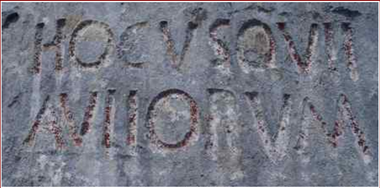
L'inscription en haut de la cheminée