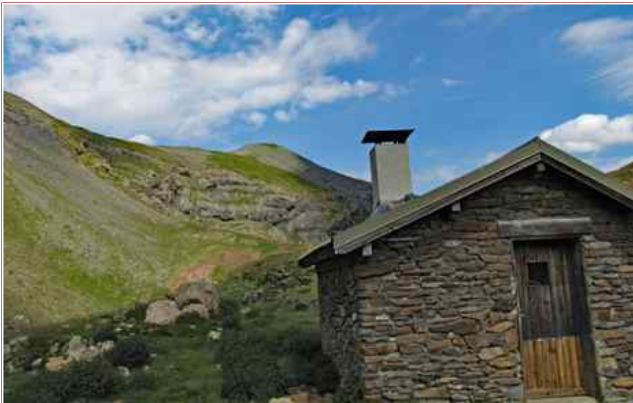
En fond le Pic Vert vu de la cabane du lac Gary

MASSIF : Ecrins/Valbonnais CARTE : IGN 3336 ET