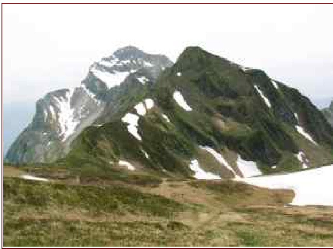
Les arêtes en direction du Mont Charvin

— Itinéraire de montée 6,3 km, 1154 m de dénivelé positif.