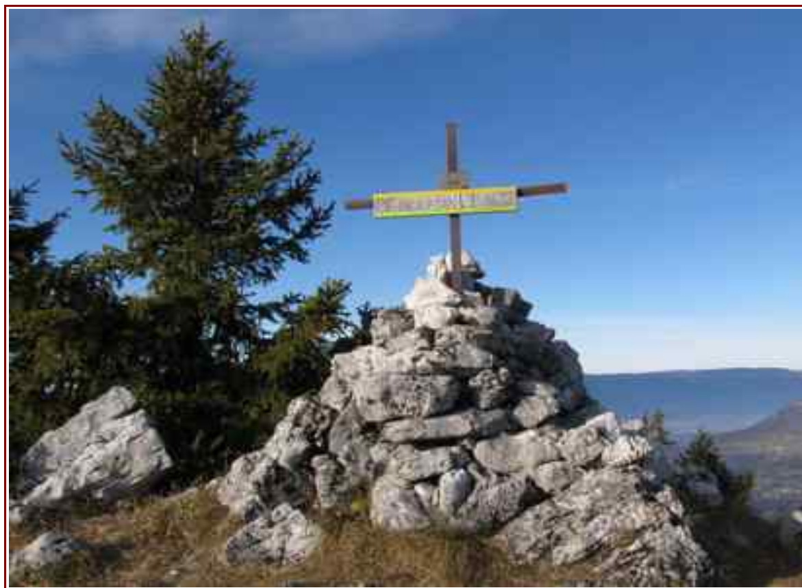
La croix du sommet