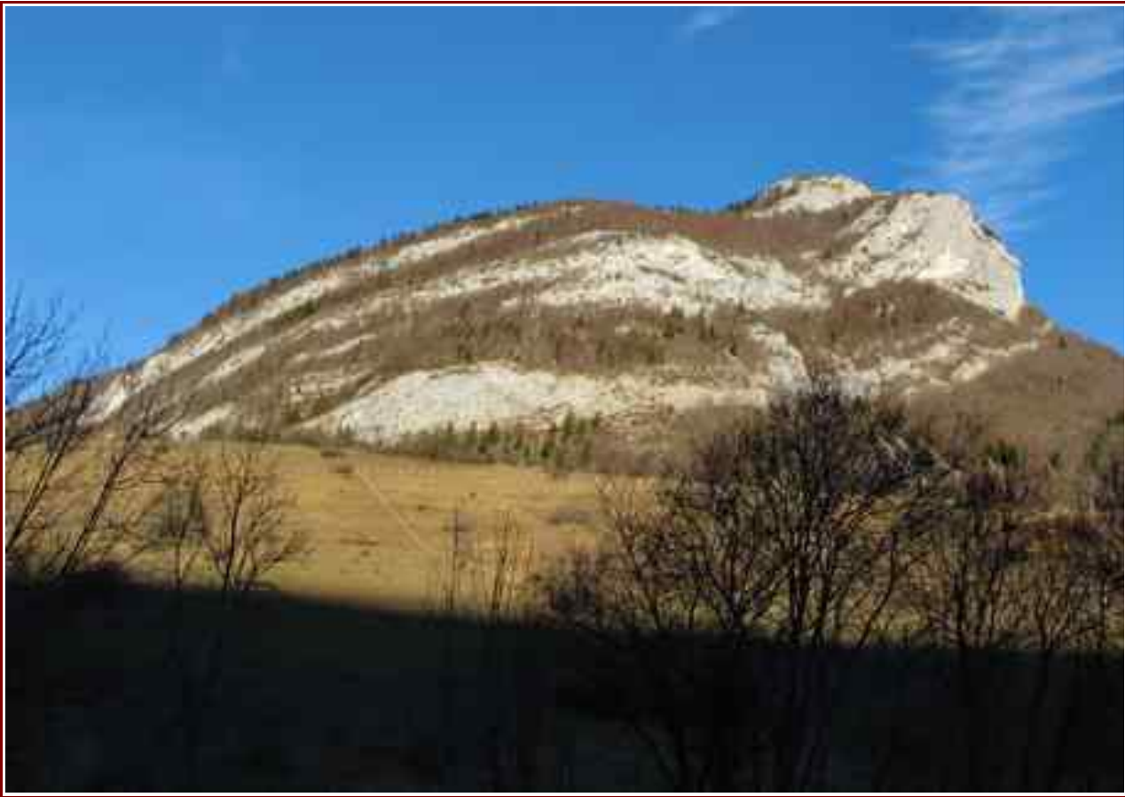
Le sommet vu du hameau de la Thuile