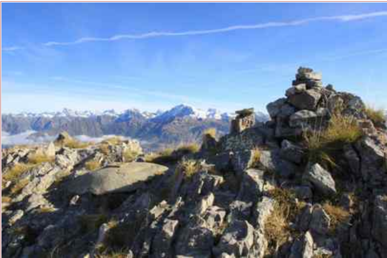
Le sommet et en fond le Vieux Chaillol.