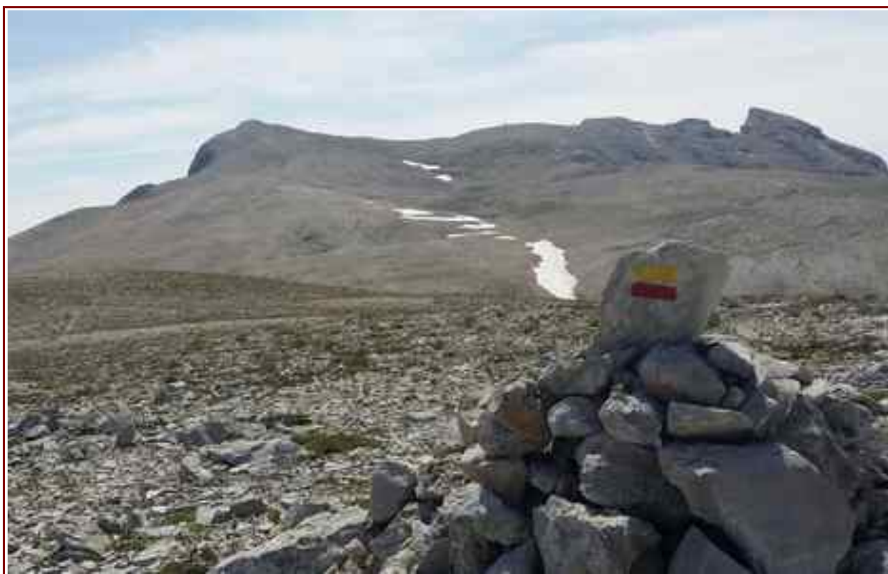
Le plateau et le sommet à gauche.