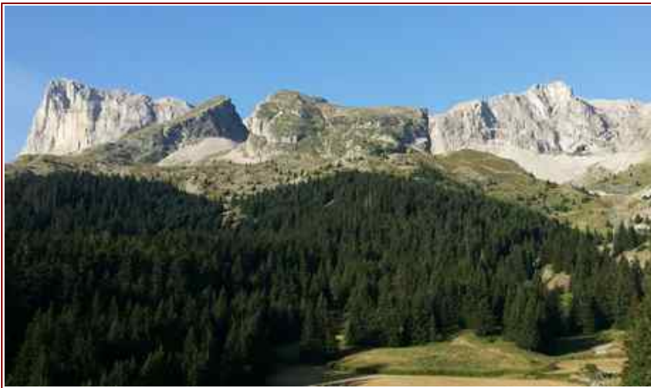
Pic de Bure vu du départ du téléphérique.