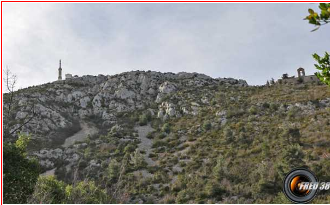
La Croix et le prieuré.