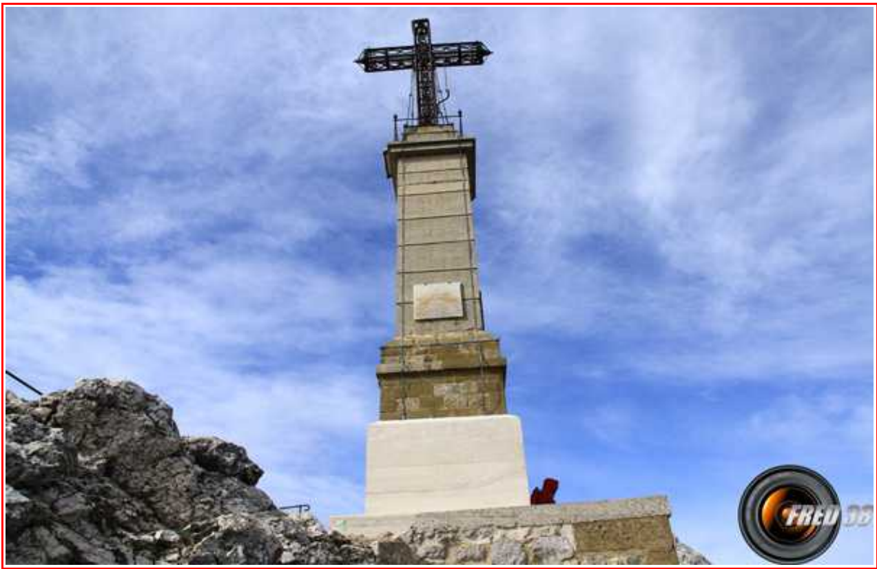
La croix du sommet.