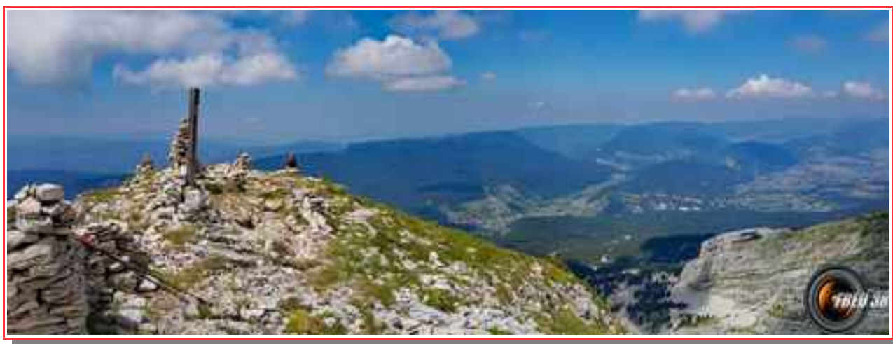
Panoramique côté ouest.

Itinéraire 900 m dénivelé, longueur 9 km