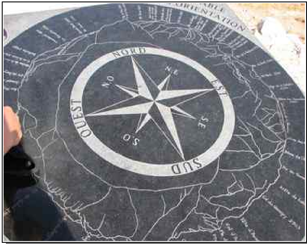
Table d'orientation au sommet