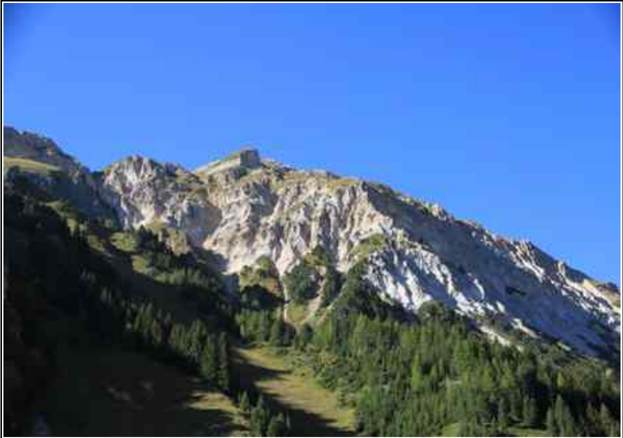
Le sommet vu des Prioux