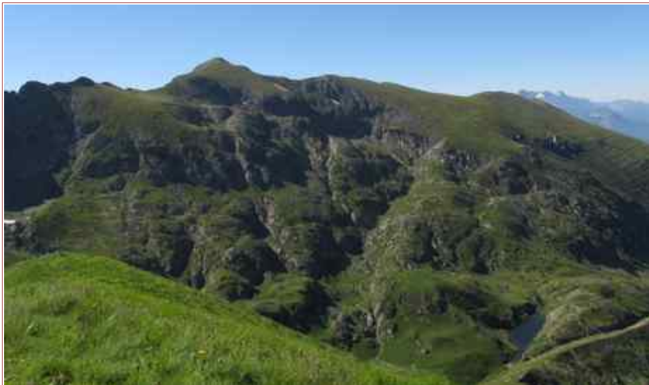
Vue du sommet, le Tabor et en fond le Dévoluy